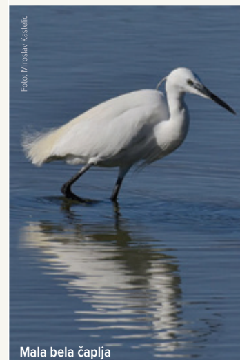
Mala bela čaplja

Slani travnik pri Sv. Nikolaju je izjemno pomembno območje tudi za ptice. Na peščenih in muljastih plitvinah ob obali, ki se izrazito položno spuščajo proti morju, najdejo hrano različne vrste pobreznikov, kot so veliki škurh ( Numenius arquata ) z dolgim, navzdol ukrivljenim kljunom, zelenonogi martinec ( Tringa nebularia ) s sivo zelenimi nogami, po katerih je dobil ime, mali martinec ( Actitis hypoleucos ) s svojim značilnim načinom letenja nizko nad vodo ali tlemi. Pogoste so tudi čaplje, kot sta mala bela čaplja ( Egretta garzetta ) in siva čaplja ( Ardea cinerea ).